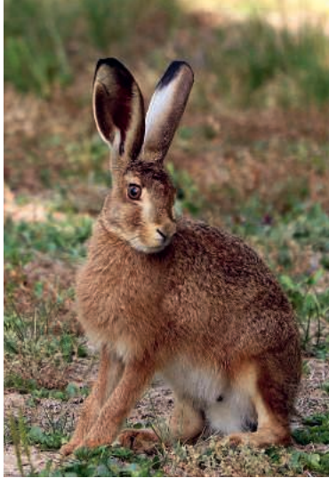
In der Wauwiler Ebene leben pro km 2 knapp vier Hasen.

Gründe für den Rückgang der Population sind Veränderungen des Lebensraums der Feldhasen, etwa durch