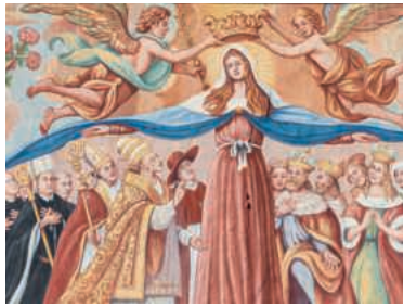
Restauriertes Bild der Schutzmantelmadonna in der Klosterkirche Disentis.