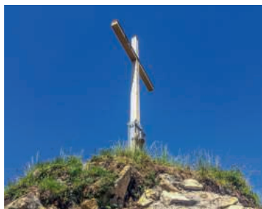
Nur für Schwindelfreie erreichbar: das neue Kreuz auf dem Bärsilikopf.

Für viele Menschen aber sind Kreuze auf Anhöhen und Berggipfeln noch immer Zeichen einer christlich geprägten Kultur. Sie werden als identitätsstiftend erlebt und gehören für sie unverzichtbar zur Bergwelt, so wie das Kuhglockengeläut auf den Alpwiesen. Selbst in unseren Tagen werden noch