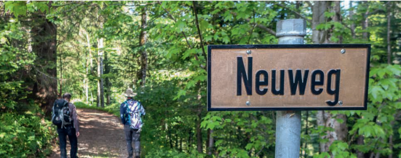
Waldstrassen-Bezeichnung beim Töss-Stock.

A usgetretene Pfade sind die sichersten, aber es herrscht viel Verkehr.