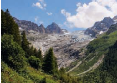
Der Trientgletscher ist seit 1990 um 1000 m zurückgegangen.