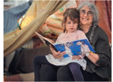
«Gemeinsam stärker» ist das Motto der Herbstsammlung von Pro Senectute.

Öffentliche Führungen: Sa, 5.9., 10.00 | Di, 13.10., 19.15 | Sa, 14.11., 10.00 | Di, 1.12., 19.15 | Anmeldung: post@luzern-kirchenschatz.org | luzern-kirchenschatz.org