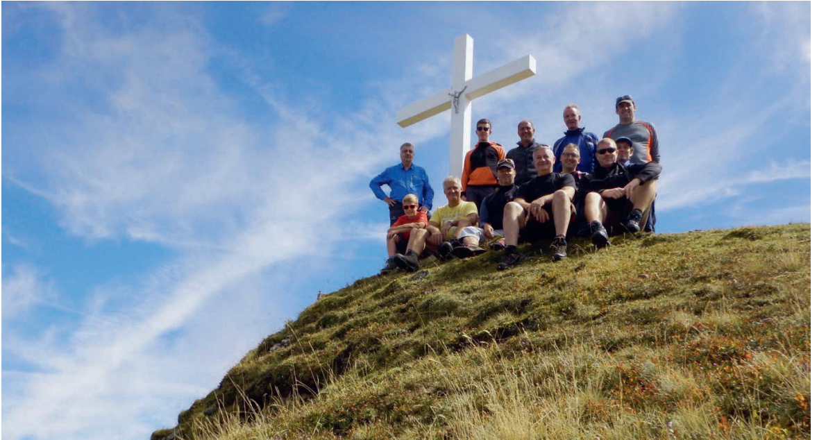
Zwölf Personen halfen im September 2018, das Kreuz auf der Schafmatt wieder aufzurichten.