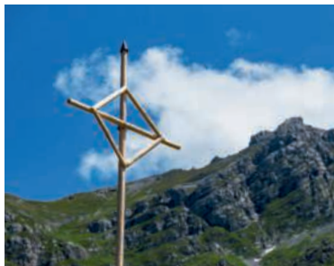
Mit Weitsicht: Kreuz auf dem Brunnli ob Engelberg.

Laut Corradini hatten Kreuze schon in früheren Zeiten nicht nur religiöse Bedeutung. Ab dem 16. Jahrhundert dienten sie der Markierung von Alp- oder Gemeindegrenzen. Das waren meist einfache Hofkreuze. Grössere Gipfelkreuze fanden erst im ausgehenden 19. Jahrhundert weitere Verbreitung. Mit dem Aufkommen des Alpinismus im 19. Jahrhundert und im Zusammenhang mit der Aufklärung wuchs das Interesse an der Wissenschaft und Gipfelkreuze wurden