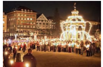
Der Klosterplatz im Lichterglanz der Engelweihe.