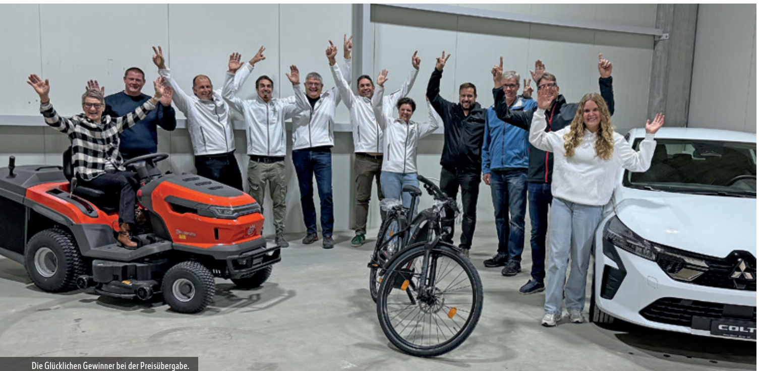
Die Glücklichen Gewinner bei der Preisübergabe.