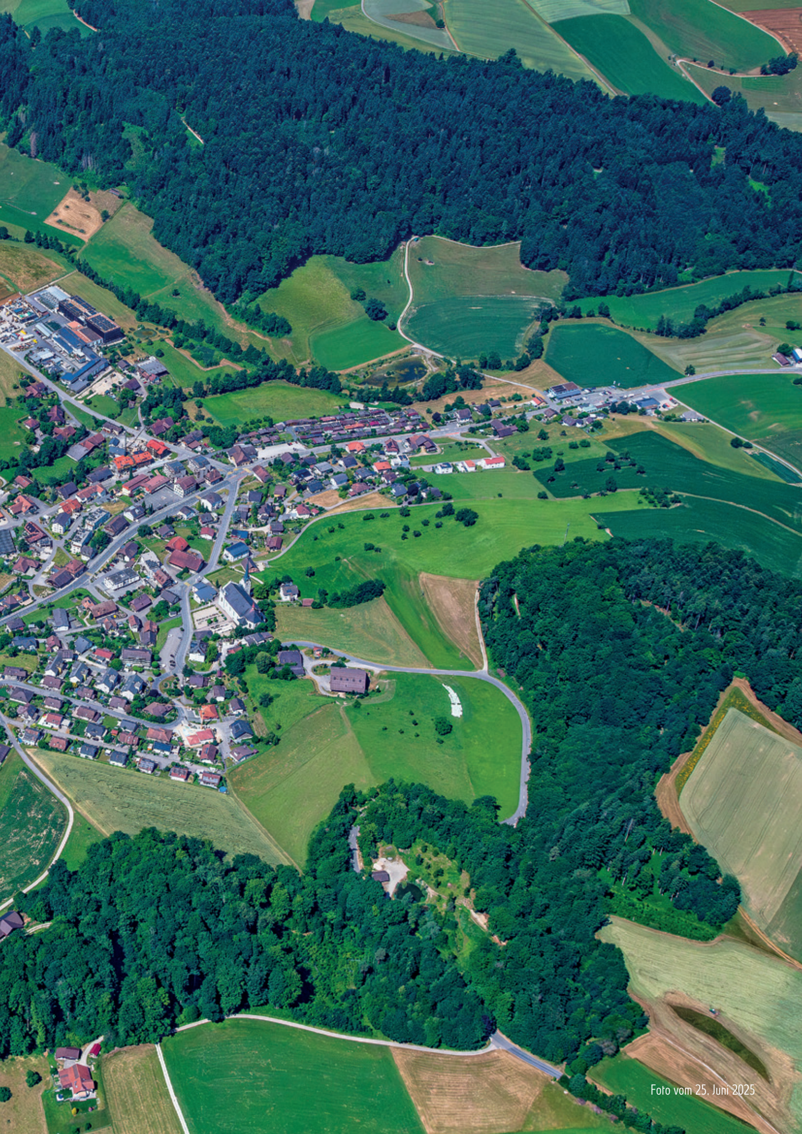
Foto vom 25. Juni 2025