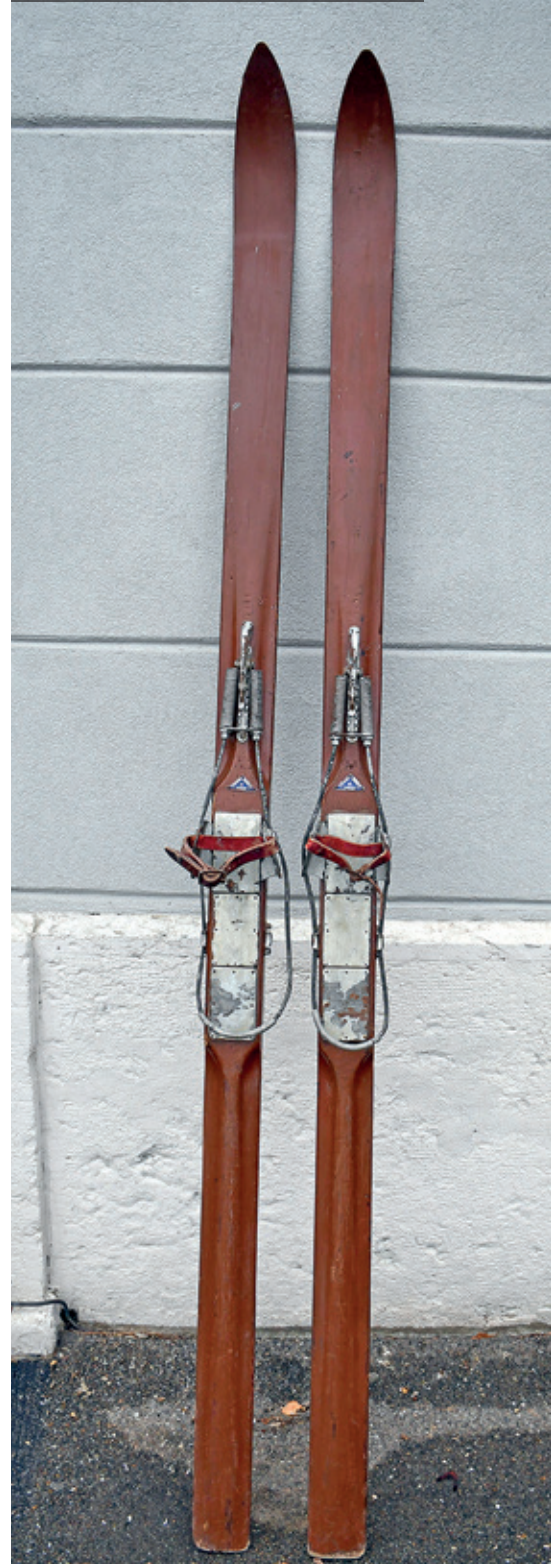
Ski aus Eschenholz, ca. 1953 hergestellt von R. Baumgartner